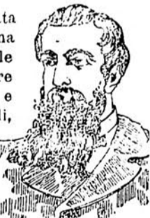
DOPO LA CURA

L'Acqua CHININA-MIGONE , preparata con sistema speciale e con materie di primissima qualità, possiede le migliori virtù terapeutiche, le quali soltanto sono un possente e tenace rigeneratore del sistema capillare. Essa è un liquido rinfrescante e limpido ed interamente composto di sostanze vegetali, non cambia il colore dei capelli e ne impedisce la caduta prematura. Essa ha dato risultati immediati e soddisfacentissimi anche quando la caduta giornaliera dei capelli era fortissima.